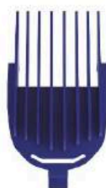
Kamm 5 mm