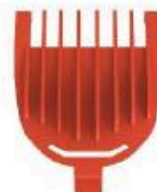
Kamm 2 mm