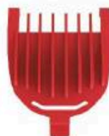
Kamm 1 mm