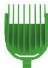
Kamm 4 mm