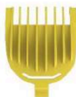
Kamm 3 mm